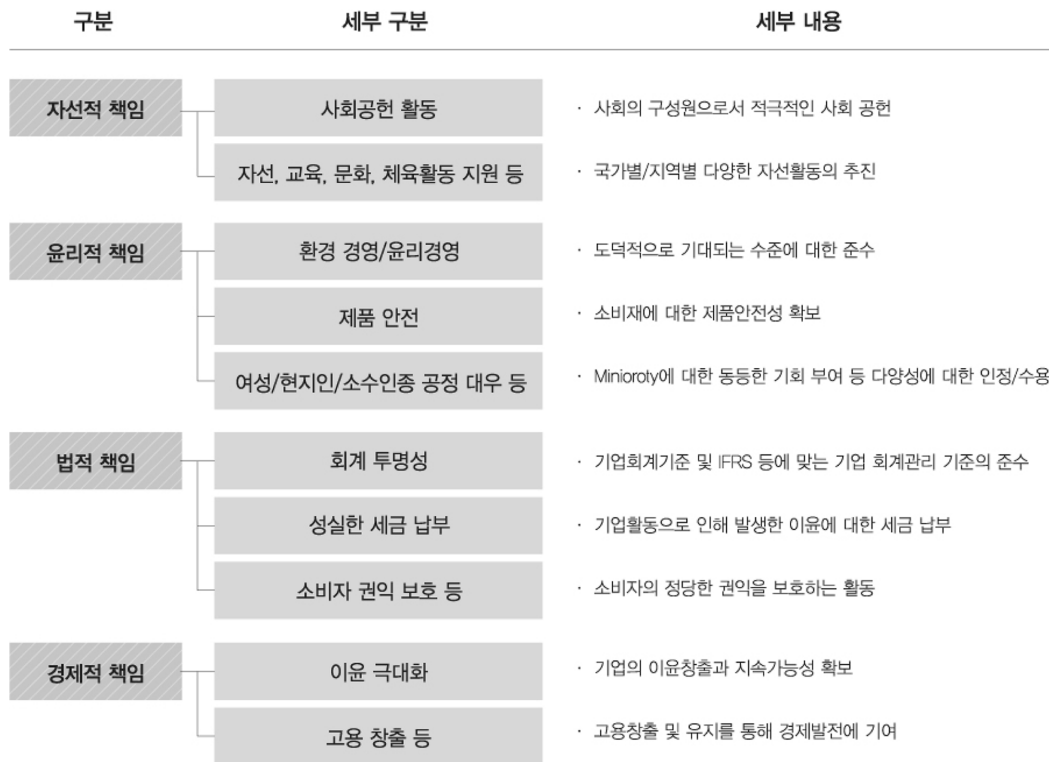
Fig. 2. Classification of economic, legal, charity responsibility.