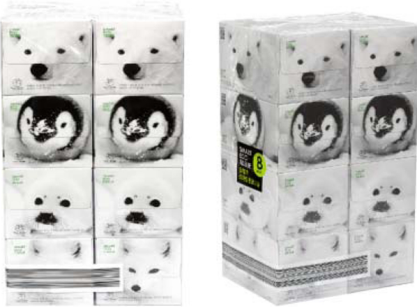
Fig. 5. Lotte Mart Smart Eco Tissue.

마케팅 측면으로 멸종 위기에 처한 동물인 북극곰, 여우, 펭귄 이미지를 포장 겉면에 적용하여 환경 보호 메시지를 전달되도록 디자인되었다.