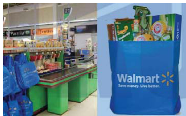
Fig. 3. Reusable bags, provided by Wal-Mart.

월마트 스토어는 포장 스코어 카드시스템 도입 외에도 2008년부터 2013년까지 재사용이 가능한 가방의 도입을 통해 각 매장 당 33%의 비닐 봉투 폐기물을 줄이는 목표를 설정하고 환경에 미치는 영향을 최소화하고자 노력하고 있다.